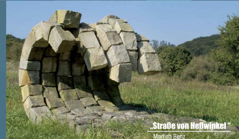
„Straße von Heßwinkel“